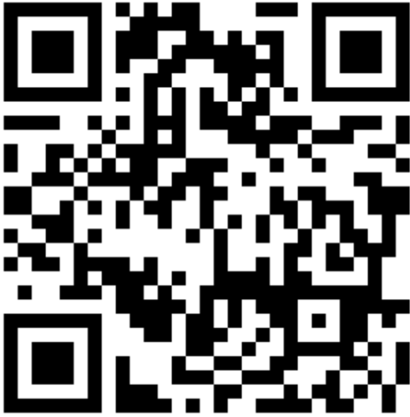
利用登録フォーム